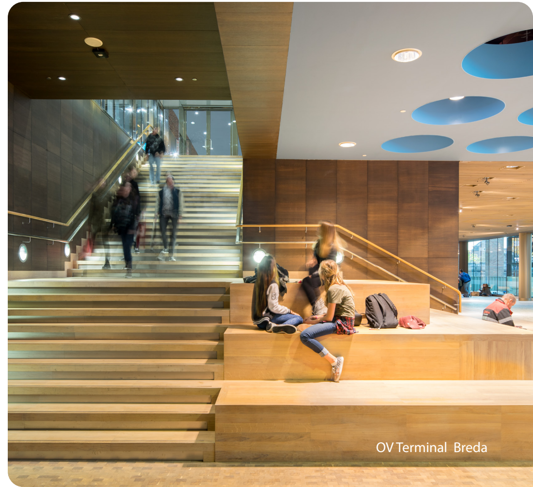
OV Terminal Breda

Pas als we de reiziger in beeld hebben, kunnen we alle voorzieningen naadloos op elkaar aan laten sluiten. Reizigers vinden dan intuïtief hun weg. Stapt deze uit de trein? Dan is een bus, tram of deelscooter nooit ver weg. In de trein regelen ze met een smartphone een deelfiets. Diverse vervoersmiddelen van verschillende aanbieders sluiten naadloos op elkaar aan. Zo wordt de overstap van het ene op het andere vervoersmiddel aantrekkelijk. Ook kan de reiziger er natuurlijk voor kiezen om in het aantrekkelijke stationsgebied te blijven.